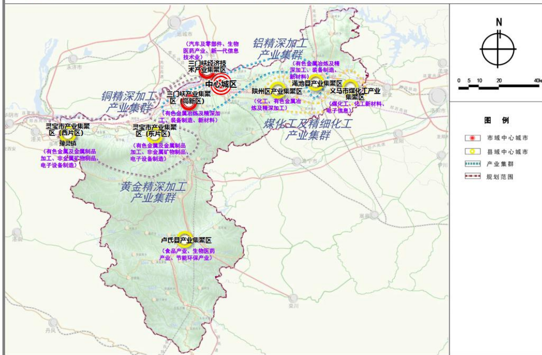
图 1：重点工业集聚区